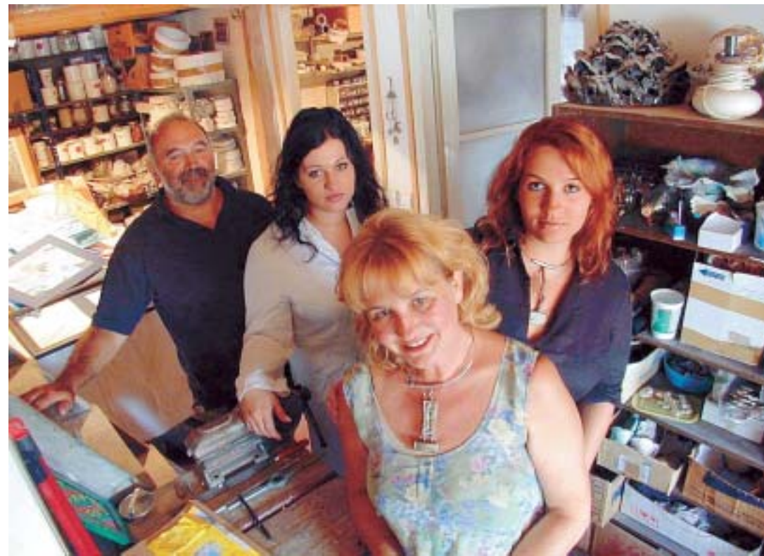
OBITELJ BRUKETA: Svaki pojedini član obitelji bi samo svojim idejama mogao ispuniti galerijski prostor

Sudeći po osmijesima kojima dočekuju i ispraćaju posjetitelje, čašici razgovora za koju se uvijek nađe vremena te toplini i optimizmu kojim zrače, obitelj Bruketa još će dugi niz godina biti jedan od najprepoznatljivijih znakova Rijeke. Ako se, pak, u gradskim strukturama nađe netko tko će ih prepoznati kao ambasadore kulture diljem svijeta, te iznađe veći i kvalitetniji prostor, sigurno je da će se Rijeci kao gradu koji teži urbanom turizmu još više otvoriti vrata svijeta